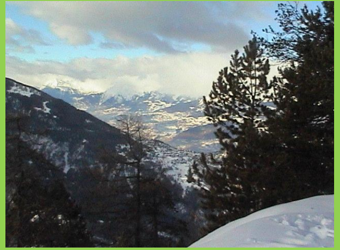
Matterhorn, Dent Blanche